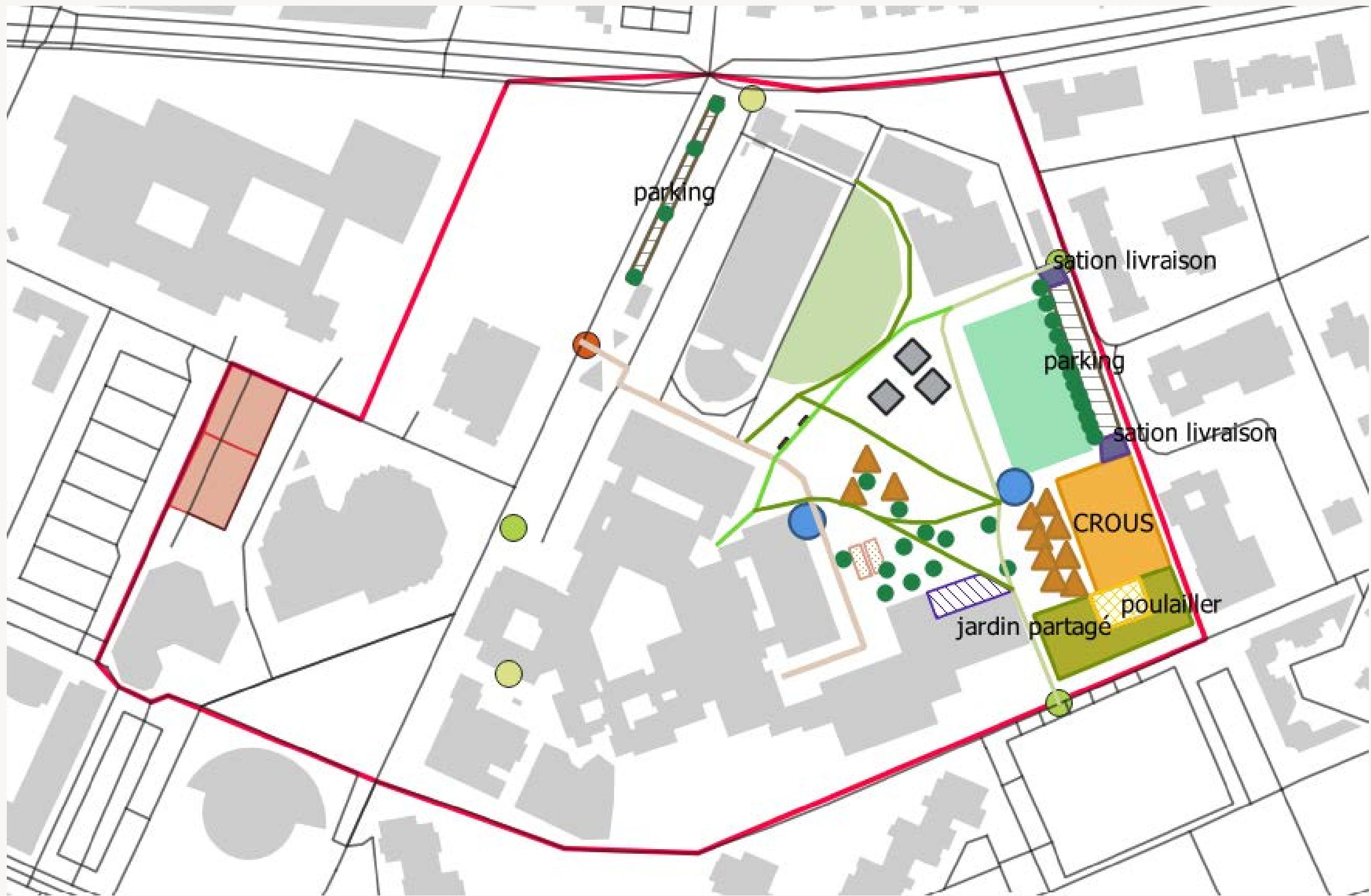
Annexe 2 - Plan récapitulatif de notre solution d'aménagement du campus de demain