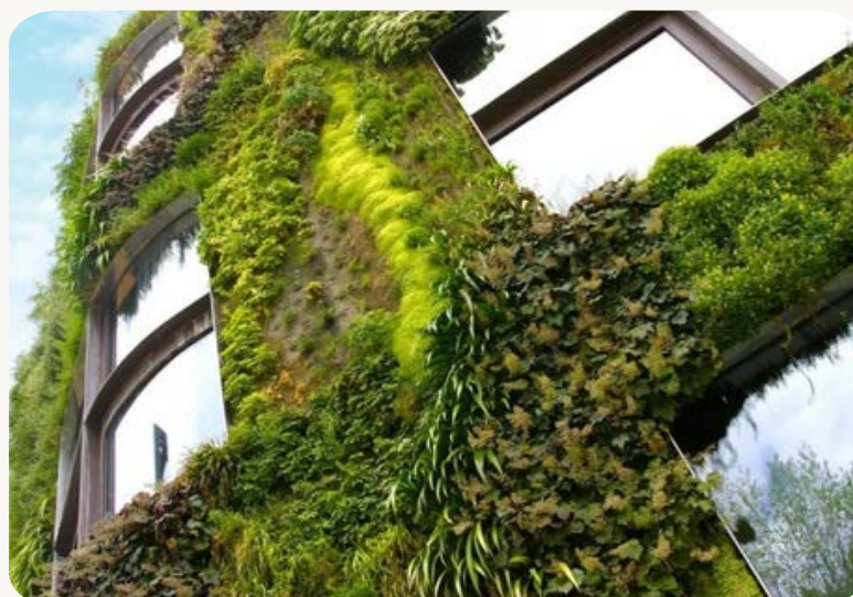
Mur végétalisé au niveau de la bissectrice