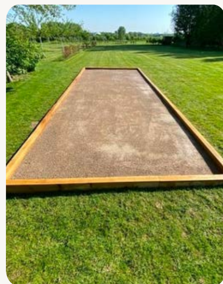
Terrains de pétanque