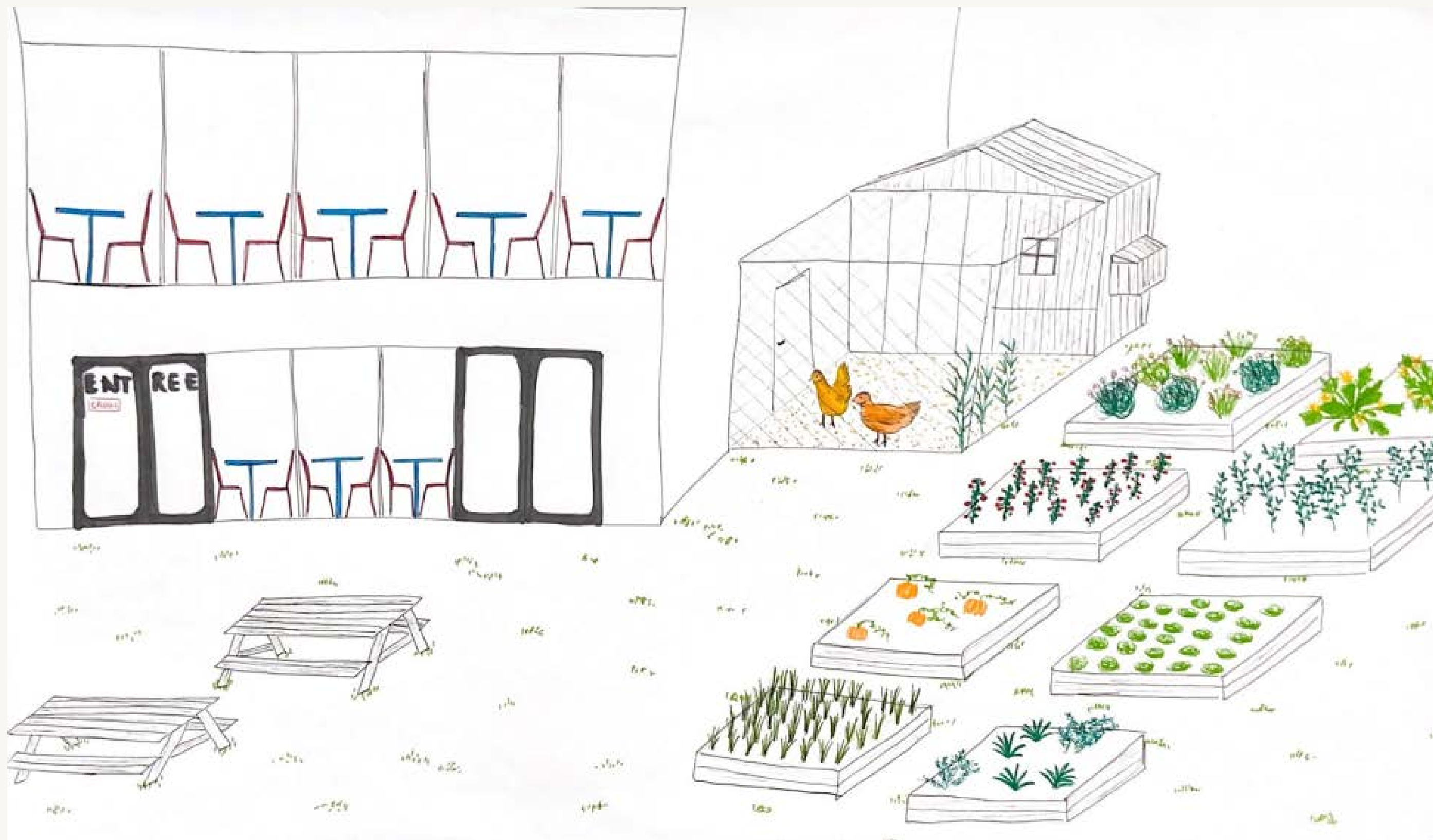
Annexe 1 - Croquis du nouvel espace restauration et jardins partagés