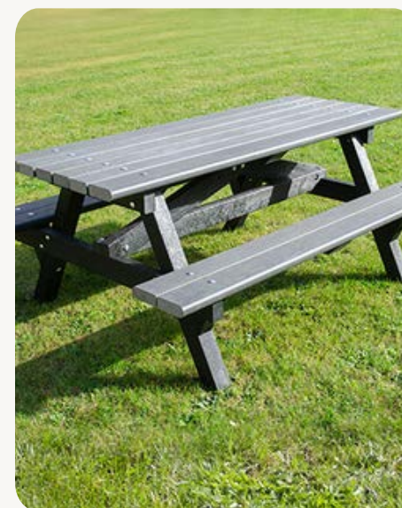
Tables de pique-nique