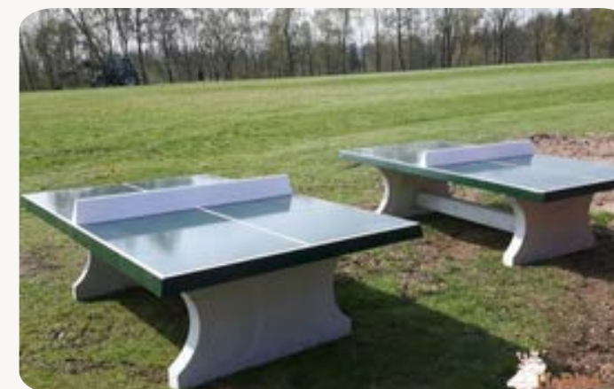
Tables de ping-pong