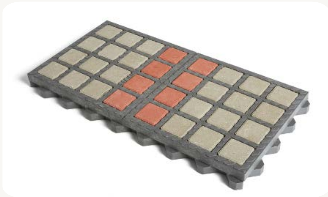
Dalle pavée drainante